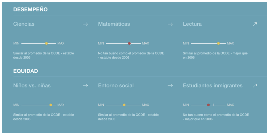
Figura 2. Desempeño en España en comparación con el promedio de la OCDE